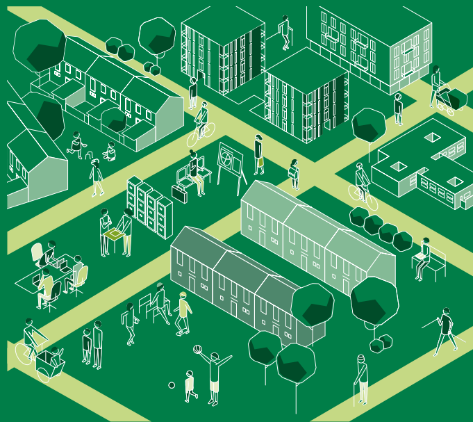
Illustrationen: Runze & Casper Werbeagentur GmbH